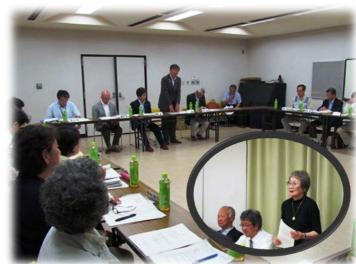
市長を囲み活発な意見交換

片瀬・江の島まちづくり協議会(片瀬地区郷土づくり推進会議の通称。以下、「協議会」といいます。)では、今後の活動を進めていくうえで、片瀬・江の島地域の課題を中心に市の考え方や方向性を改めて確認するため、5月25日(月)に協議会委員と市長等市理事者との意見交換の場を設け、協議会委員21人、鈴木市長、石井副市長、藤間副市長、渡辺市民自治部長が同席する中、約1時間に渡り中身の濃い意見交換を行いましたので、ご報告いたします。