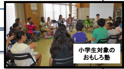
小学生対象のおもしろ塾