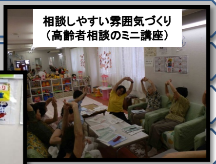
相談しやすい雰囲気づくり(高齢者相談のミニ講座)